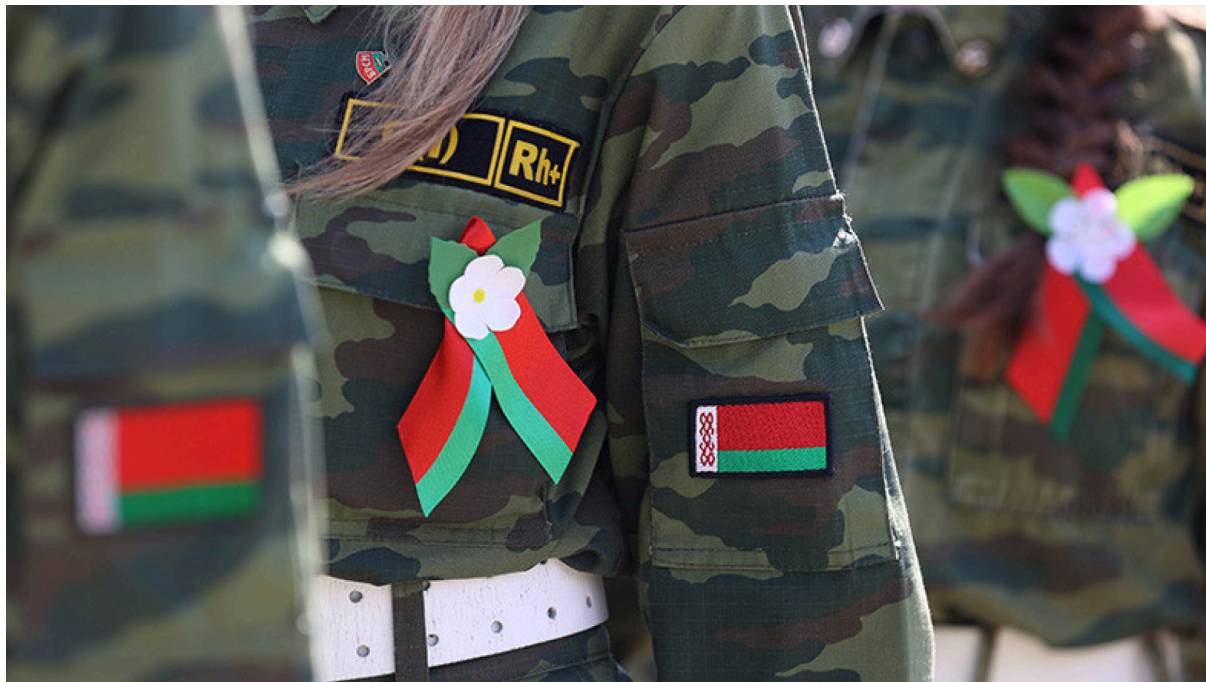
Девочки военно-патриотических классов школ Беларуси.