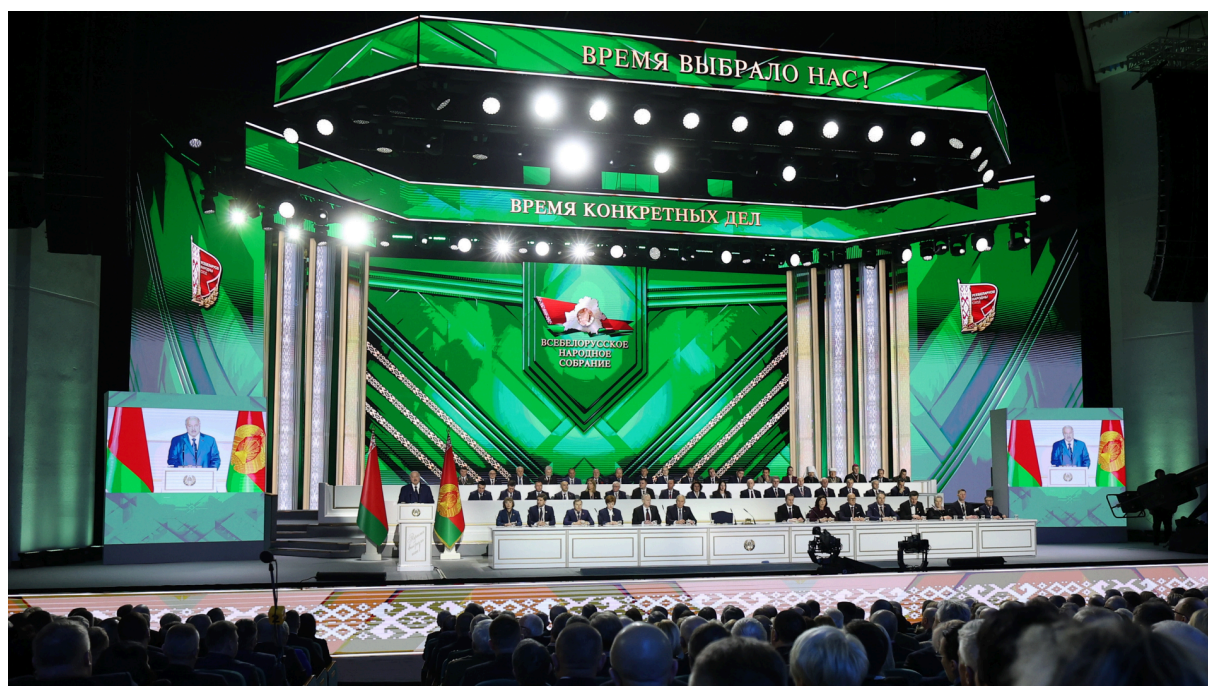
Второе заседание VII Всебеларуского народного собрания.