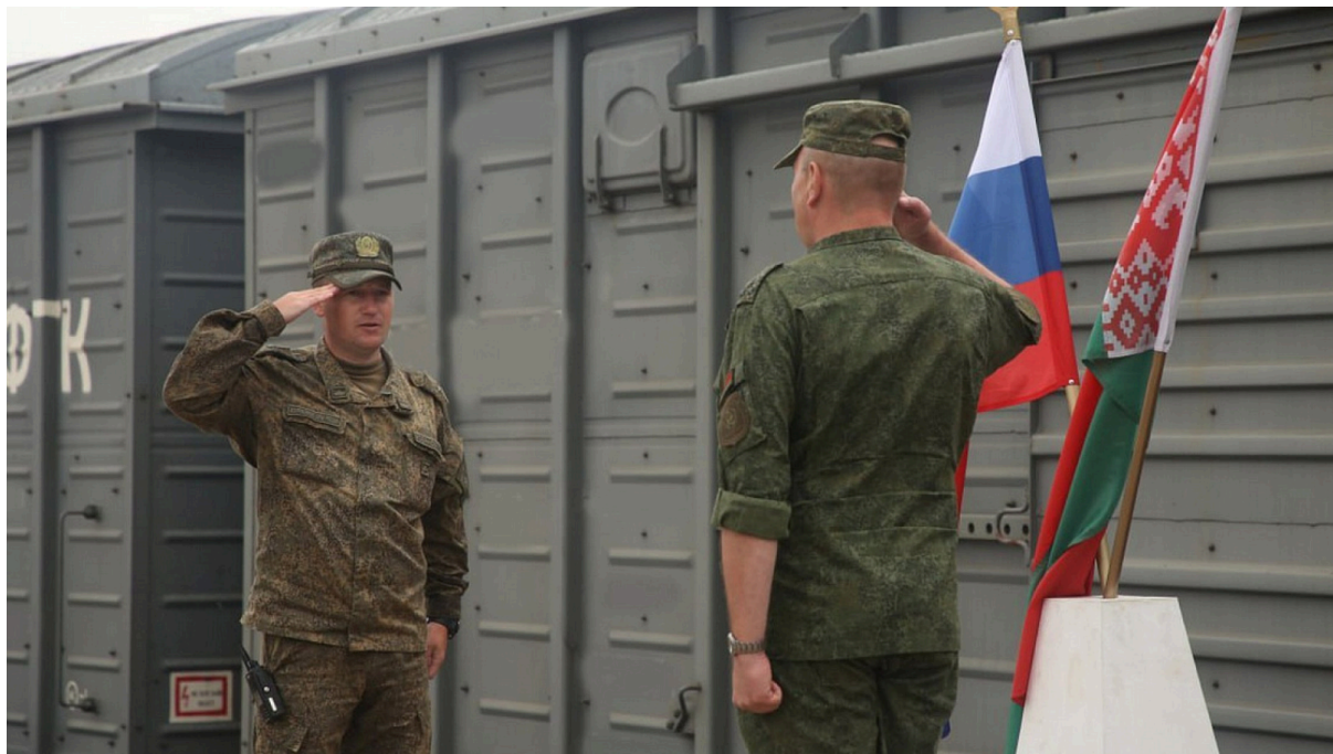
Военные учения РФ и Беларуси «Запад-2025».