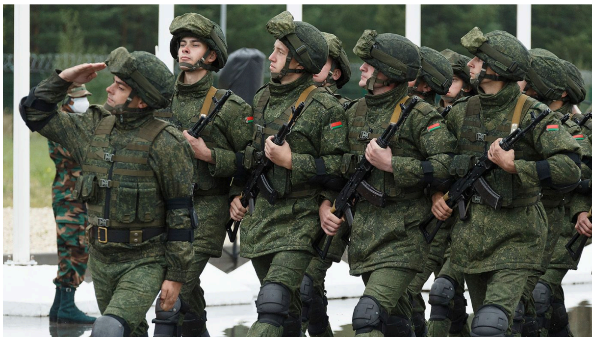
Беларуские военнослужащие.