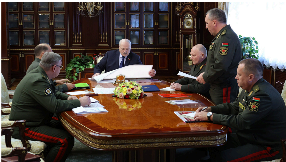
Совещание по вопросам военной безопасности